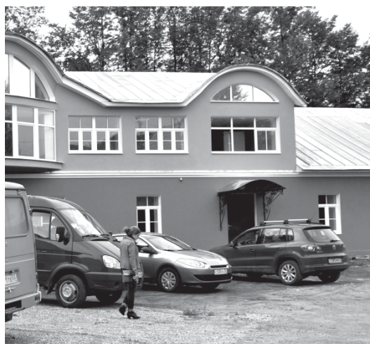
В здании Технопарка продолжен ремонт внутренних помещений и фасада, утеплены чердачные перекрытия, установлена вентиляция.

В этом году впервые введена квота на приём детей-льготников в размере 10%. Часть поступающих из этой категории не прошла по конкурсу и будет учиться платно.