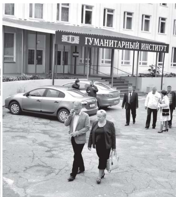
В Антонове (ИГУМ), проведены: ремонт фасада и дороги (ямочный); замена труб водоснабжения и отопления; в здании отремонтированы кабинет директора и ректорат, музей, аудитории, коридоры и т.д.

Федеральным законом установлено, что согласно новому порядку, университеты будут сдавать в наём жильё студен-