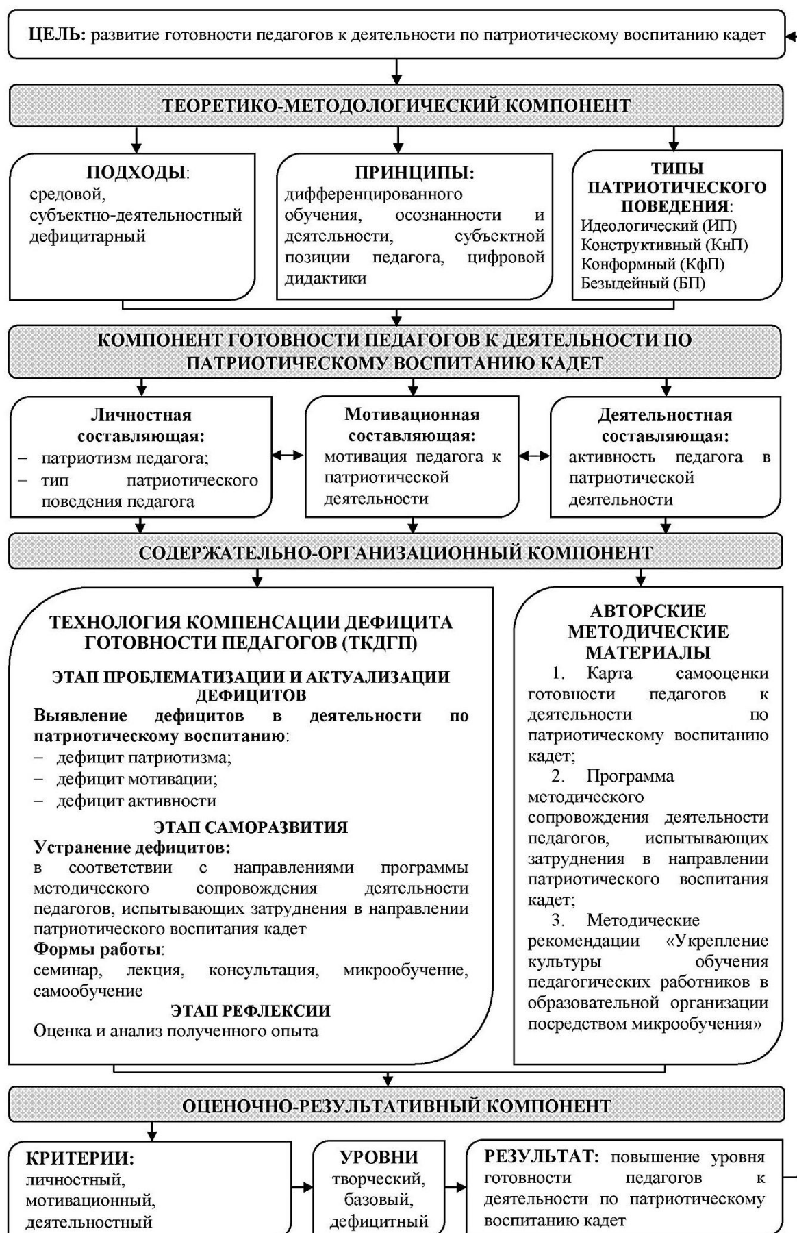
Рисунок 1 – Модель развития готовности педагогов к деятельности по патриотическому воспитанию кадет